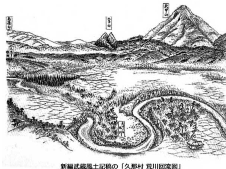
新編武蔵風土記稿の「久那村 荒川回流図」

石灰岩を産出し、身を削って秩父を支える武甲山、私たちが暮らす秩父盆地、そして、荒川の巴川と云われる曲流はどのようにしてできたのか、秩父山地と秩父盆地の成り立ちを分かりやすく解説いたします。