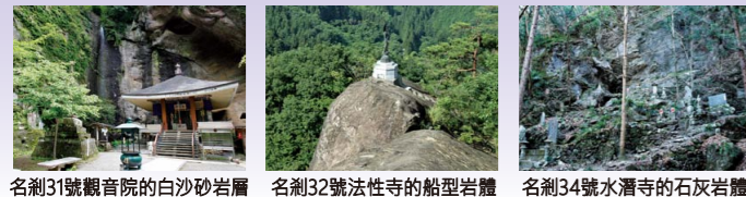
名剎31號觀音院的白沙砂岩層 名剎32號法性寺的船型岩體 名剎34號水瀧寺的石灰岩體

從古至今，秩父是匯集人們信仰的地方。從秩父三大神社或者秩父名剎觀音道場等具有代表性的寺社中，人們能感受到地形的神祕，並對其中最多的獨特景觀重點保護並傳承。感受人們的信仰和大地的緊密聯繫，讓我們一邊巡遊這些地質景觀，一邊展開心靈的旅行吧！