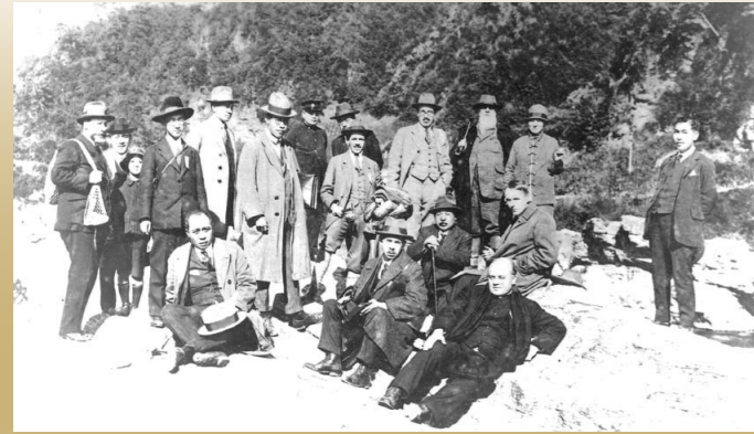
▲第三屆泛太平洋學術會議之秩父巡迴檢查 (1926)

明治時代，日本的近代地質學迎來黎明，多數的學者和學生開始到秩父當地訪問。從被稱為「地球之窗」的長瀨岩壘開始，讓我們循著宮澤賢治和Nanmann博士的足跡，一起去巡遊他們走過的地質景觀，一起去探尋秩父大地告訴我們的地球形成的故事吧！