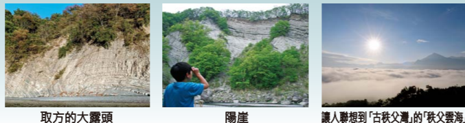
取方的大露頭 隔崖 讓人聯想到「古秩父灣」的「秩父雲海」

數千百萬年前，秩父盆地曾是一片廣闊的大海。從6處山崖的地層中可以看到該地曾經是海洋的證據。當時生存的古索齒獸等海獸的化石群以「古秩父灣堆積層及海棲哺乳類化石群」的名稱，被指定為國家的天然紀念物。讓我們一起穿越回到秩父的大海時代吧！