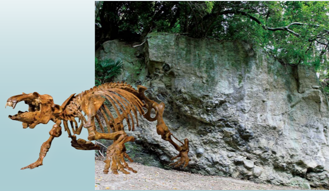
▲古索齒獸的骨骼標本・前原的不整合面

數千百萬年前，秩父盆地曾是一片廣闊的大海。從6處山崖的地層中可以看到該地曾經是海洋的證據。當時生存的古索齒獸等海獸的化石群以「古秩父灣堆積層及海棲哺乳類化石群」的名稱，被指定為國家的天然紀念物。讓我們一起穿越回到秩父的大海時代吧！