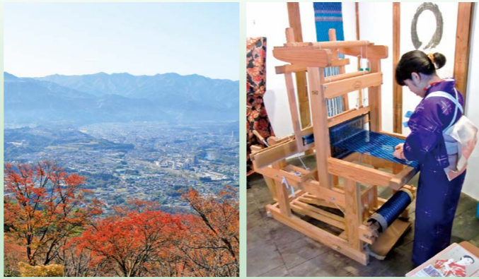
▲秩父盆地 (從美之山公園眺望) ▲秩父銘仙的織布

不管在哪个時代，受大地的恩澤發展起來的產業和豐富多彩的文化賦予了該地無限的活力。不管是被絲織物點綴的秩父夜祭歷史，還是吸引平賀源內的礦石光輝，抑或是秩父的名產蕎麥麵，實際上這些都和地質有著緊密的聯繫。因此，讓我們一起來探尋這些神奇的故事吧！