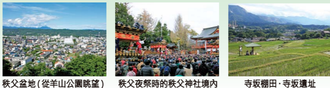
秩父盆地 (從羊山公園眺望) 秩父夜祭時的秩父神社境內 寺坂棚田・寺坂遺址

不管在哪个時代，受大地的恩澤發展起來的產業和豐富多彩的文化賦予了該地無限的活力。不管是被絲織物點綴的秩父夜祭歷史，還是吸引平賀源內的礦石光輝，抑或是秩父的名產蕎麥麵，實際上這些都和地質有著緊密的聯繫。因此，讓我們一起來探尋這些神奇的故事吧！