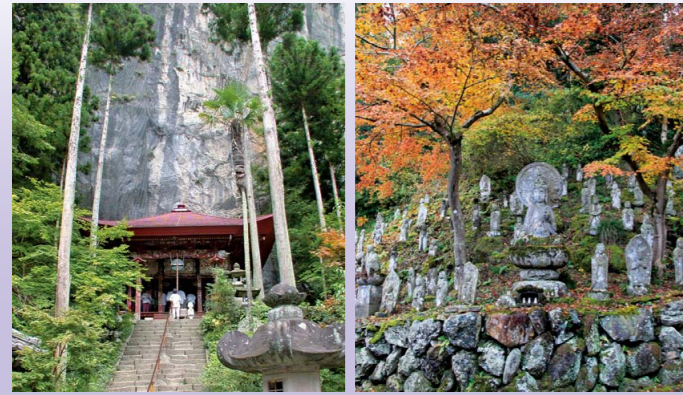
▲名剎28號獨立堂 (岩壘和觀音堂) ▲名剎4號金昌寺的石佛

從古至今，秩父是匯集人們信仰的地方。從秩父三大神社或者秩父名剎觀音道場等具有代表性的寺社中，人們能感受到地形的神祕，並對其中最多的獨特景觀重點保護並傳承。感受人們的信仰和大地的緊密聯繫，讓我們一邊巡遊這些地質景觀，一邊展開心靈的旅行吧！