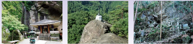
名刹31号观音院的白沙砂岩层 名刹32号法性寺的船形岩体 名刹34号水潜寺的石灰岩体

从古至今，秩父是汇集人们信仰的地方。从秩父三大神社或者秩父名刹观音道场等具有代表性的寺社中，人们能感受到地形的神秘，并对其众多的独特景观重点保护并传承。感受人们的信仰和大地的紧密联系，让我们一边巡游这些地质景观，一边展开心灵的旅行吧！