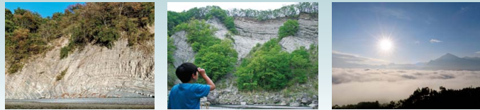
取方的大露头 阳崖 让人联想到「秩父湾」的「秩父云海」

数千万年前，秩父盆地曾是一片广阔的大海。从6处山崖的地层中可以看到该地曾经是海洋的证据。当时生存的古索齿兽等海兽的化石群以「古秩父湾堆积层及海栖哺乳类化石群」的名称，被指定为国家的天然纪念物。让我们一起穿越回到秩父的大海时代吧！