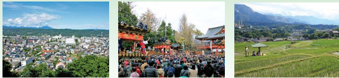
秩父盆地 (从羊山公园眺望) 秩父夜祭时的秩父神社境内 寺坂梯田·寺坂遗址

不管在哪个时代，受大地的恩泽发展起来的产业和丰富多彩的文化赋予了该地无限的活力。不管是被丝织物点缀的秩父夜祭历史，还是吸引平贺源内的矿石光辉，抑或是秩父的名产荞麦面。实际上这些都和地质有着紧密的联系。因此，让我们一起来探寻这些神奇的故事吧！