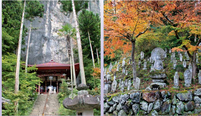
▲名刹28号桥立堂 (岩壁和观音堂) ▲名刹4号金昌寺的石佛

从古至今，秩父是汇集人们信仰的地方。从秩父三大神社或者秩父名刹观音道场等具有代表性的寺社中，人们能感受到地形的神秘，并对其众多的独特景观重点保护并传承。感受人们的信仰和大地的紧密联系，让我们一边巡游这些地质景观，一边展开心灵的旅行吧！