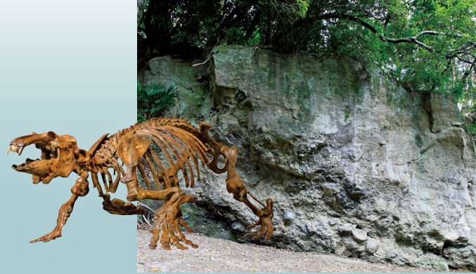
▲古索齿兽的骨骼标本·前原的不整合面

数千万年前，秩父盆地曾是一片广阔的大海。从6处山崖的地层中可以看到该地曾经是海洋的证据。当时生存的古索齿兽等海兽的化石群以「古秩父湾堆积层及海栖哺乳类化石群」的名称，被指定为国家的天然纪念物。让我们一起穿越回到秩父的大海时代吧！