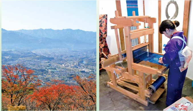
▲秩父盆地 (从美之山公园眺望) ▲秩父铭仙的织布

不管在哪个时代，受大地的恩泽发展起来的产业和丰富多彩的文化赋予了该地无限的活力。不管是被丝织物点缀的秩父夜祭历史，还是吸引平贺源内的矿石光辉，抑或是秩父的名产荞麦面。实际上这些都和地质有着紧密的联系。因此，让我们一起来探寻这些神奇的故事吧！