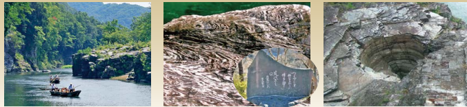
岩壘和秩父赤壁 虎岩和官泽贤治的歌碑 红帘石片岩和匹穴

明治时代，日本的近代地质学迎来黎明，多数的学者和学生开始到秩父当地访问。从被称为「地球之窗」的长瀨岩壘开始，让我们循着官泽贤治和 Naumann 博士的足迹，一起去巡游他们走过的地质景观，一起去探寻秩父大地告诉我们的地球形成的故事吧！