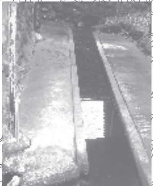
▲妙見七ツ井戸:四の井戸(下堀の井戸)

●妙見七ツ井戸 妙見菩薩が秩父神社に合祀された際、宮地の妙見宮から秩父神社まで渡っていったとされる七つの井戸(段丘崖の湧水)。