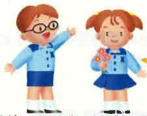
浦山ダムマスコット ウラオ&ウララ