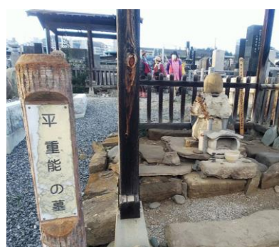
円福寺 平重能の墓