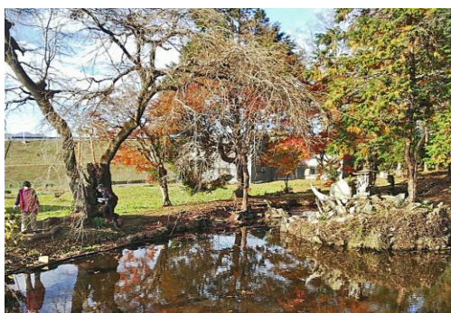
小池氏館跡（大塚池）